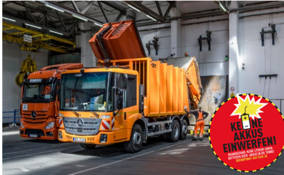
Batterien im Hausmüll können Brände sowohl in den Müllfahrzeugen verursachen als auch im Müllbunker des MHKW Coburg. Besonders gefährlich sind Lithium-Ionen-Batterien, die sich kaum löschen lassen.

Entsorgen Sie diese Batterien und Akkus daher umgehend, am besten im Elektrofachhandel oder auf dem Wertstoffhof und vorsorglich so, dass sie von Mitarbeitenden